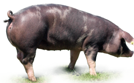
PUŁAWSKA Na Liście Produktów Tradycyjnych Rasa zachowawcza