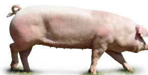
POLSKA BIAŁA ZWISŁOUCHA Na Liście Produktów Tradycyjnych